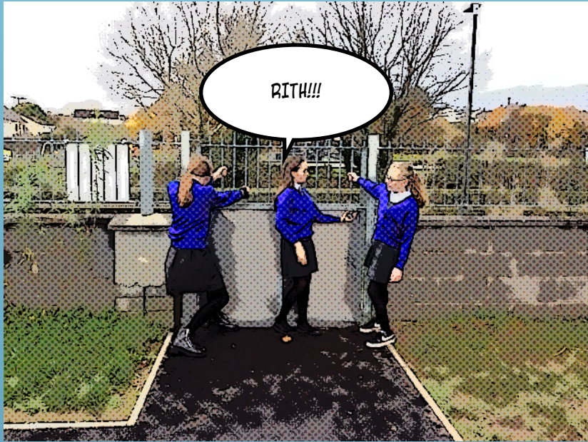
Ní raibh said in ann éalú