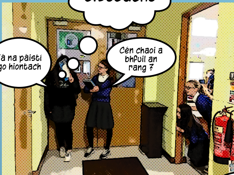
Tá múinteoir soracha ag plé rang 6