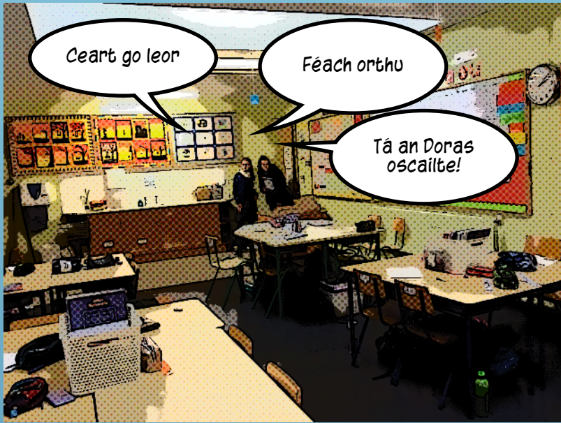
Ach nuair a doscail sí an Doras bhí an seomra Polamh !!