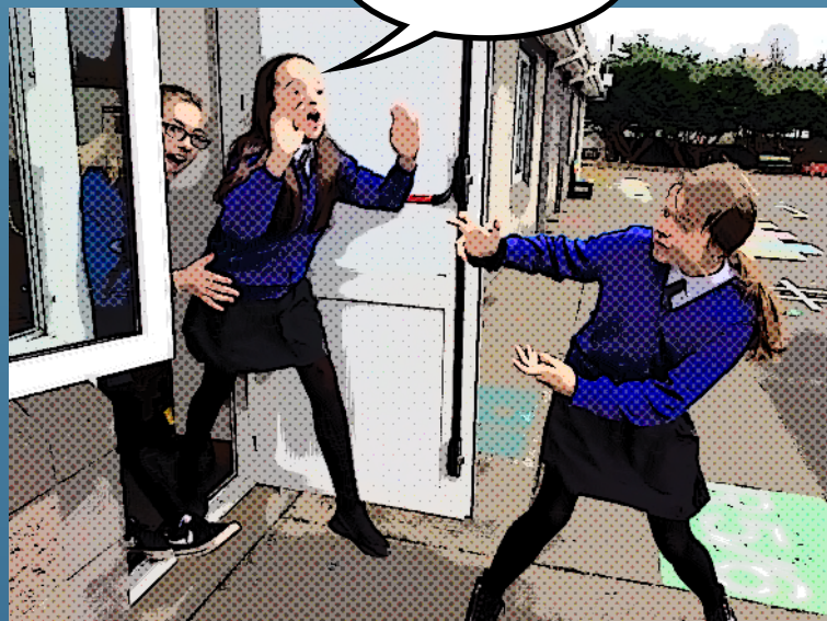
Bhí plean acu